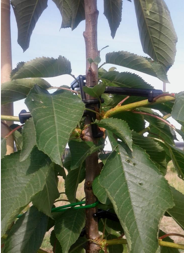
Slika 2: Aktivacija brstov in razpiranje poganjkov